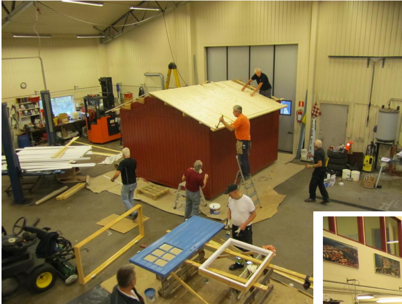
Första stugan börjar ta form