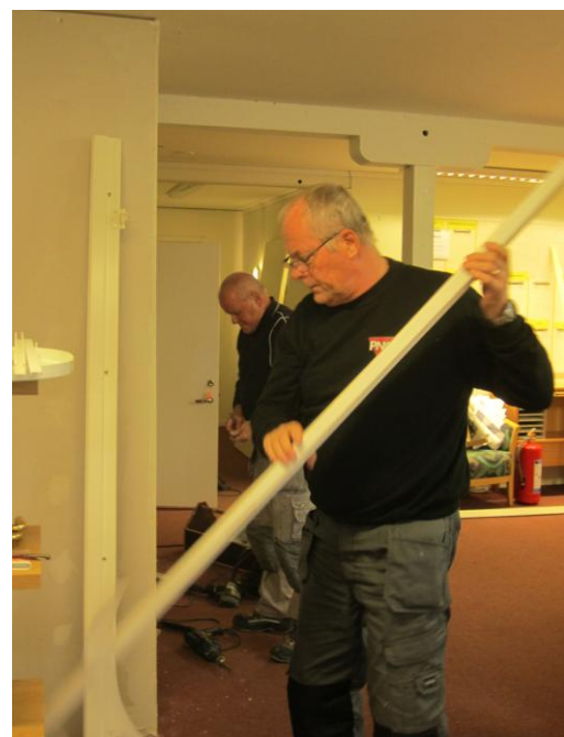
Inne på kansliet började vi riva och lägga sista handen på de två nya förråden.