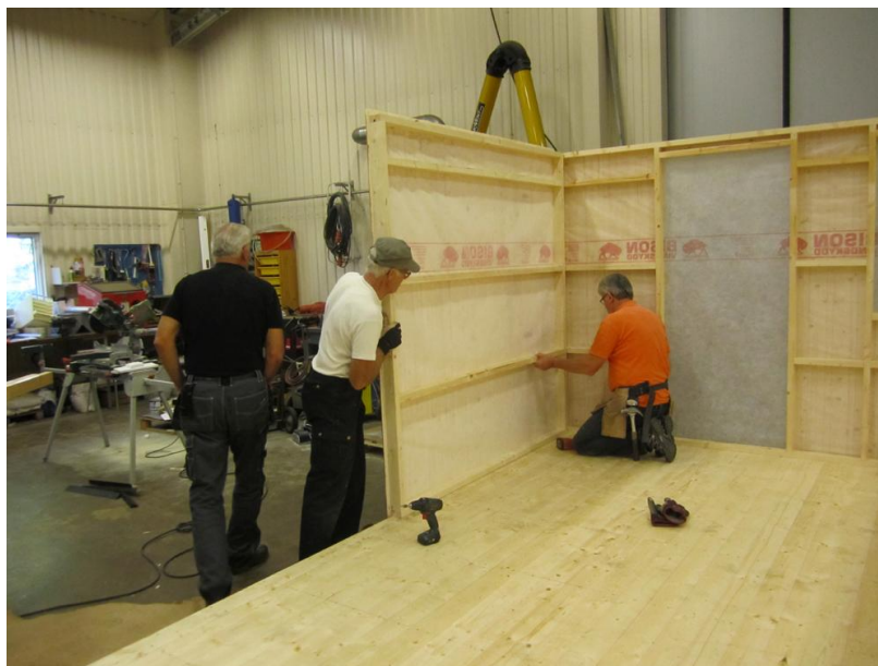
Hus nr 2 börjar ta form.