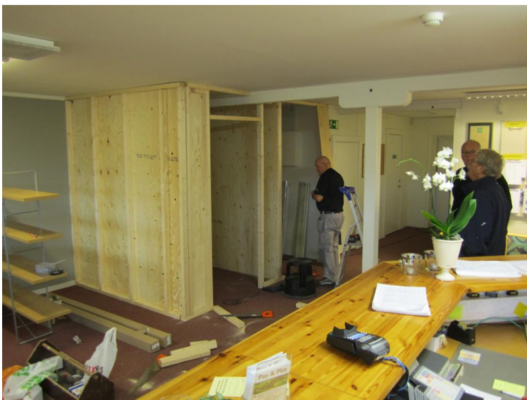
Uppe i kansliet började förråden ta form