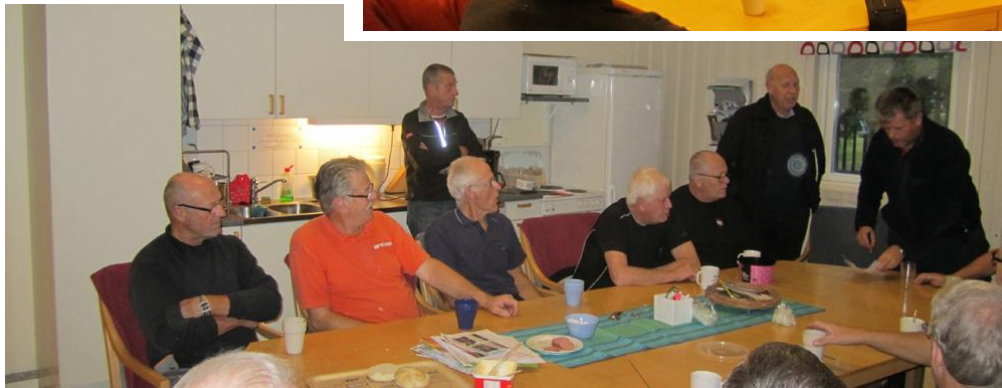
Det är som under en golfgrunda. KAFFET är det bästa.