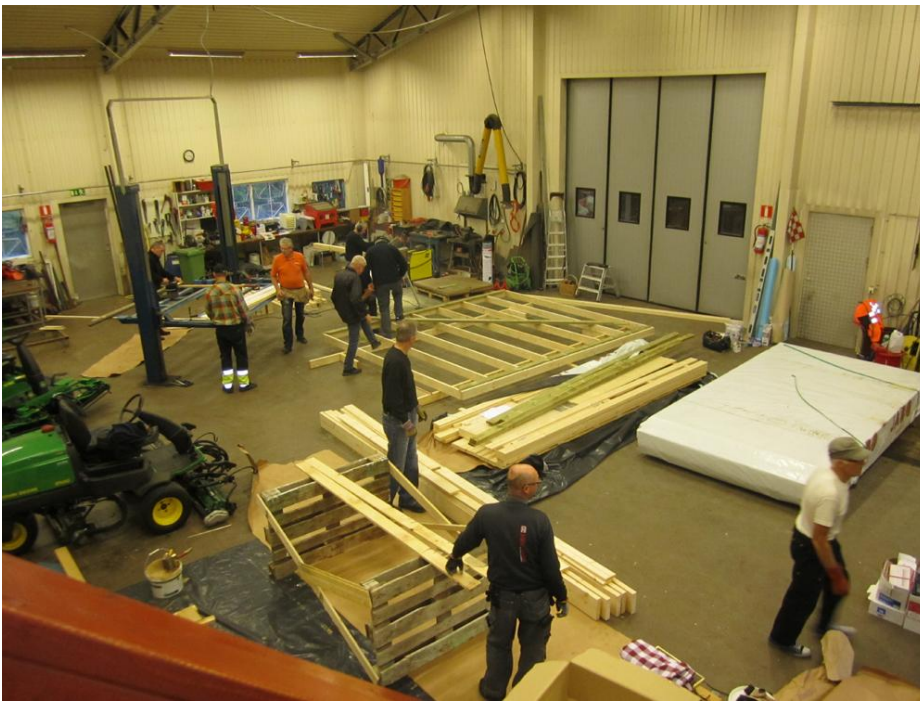
Sällan har det väl varit sådan aktivitet i maskinhallen.