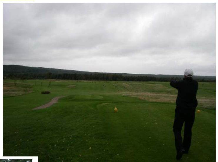
Däråt skall vi skicka iväg bollen