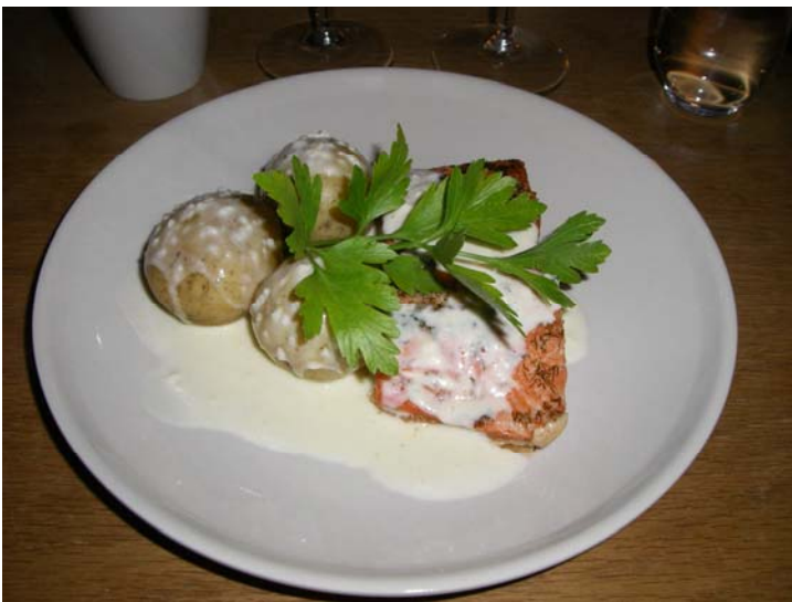
Varmrätt var lax med färskpotatis