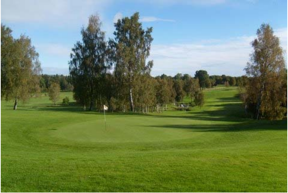
Artonde hålet med en uppförsbacke som vida övertrumfar Skinnarebo