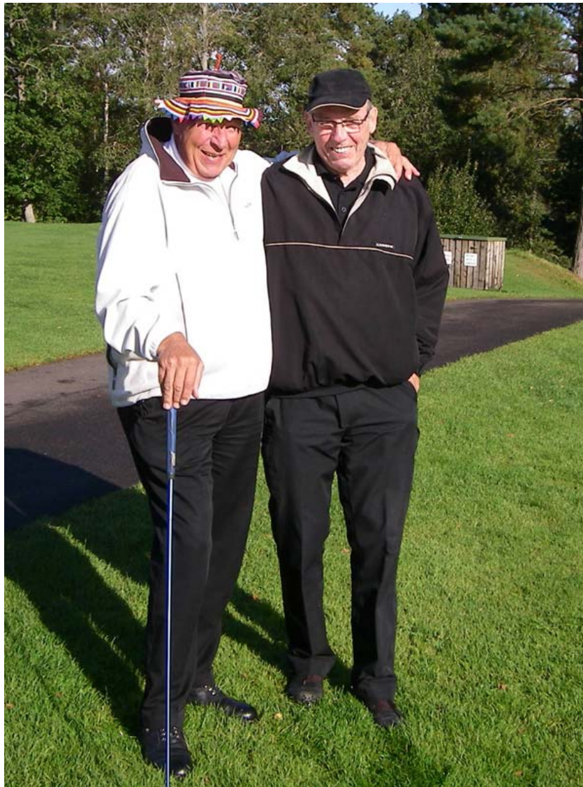
Så här glad kan man se ut i väntan på att få slå ut.