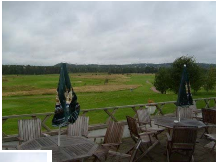
Golfbanan sedd från restaurangens uteservering