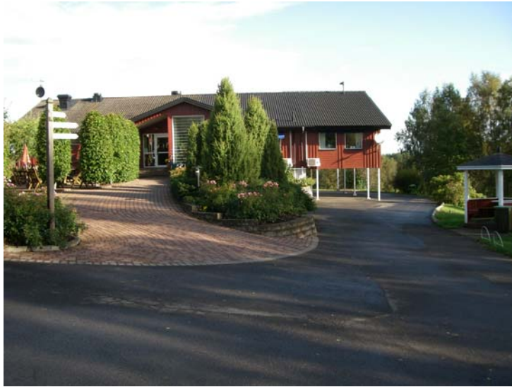
Falköpings golfklubbs klubbhus