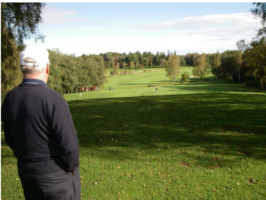
Första hålet med den förrådiska bäcken där nere i dalen