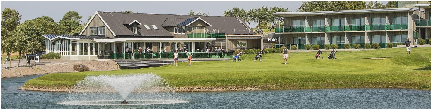
Det här var en fantastiskt fin anläggning.