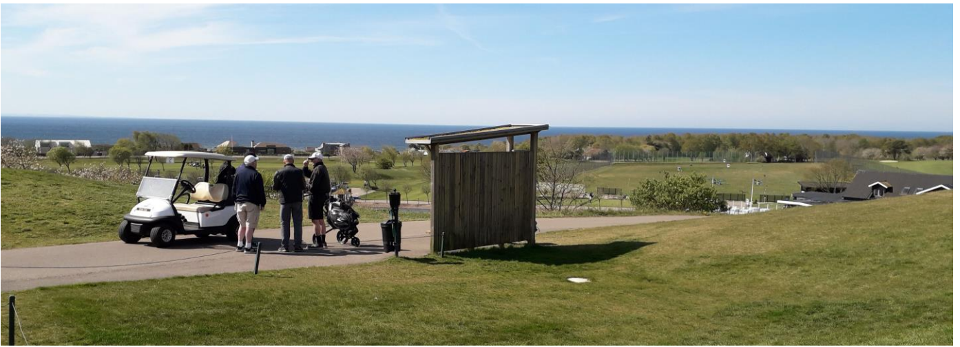
En fantastisk vy vid första tee.