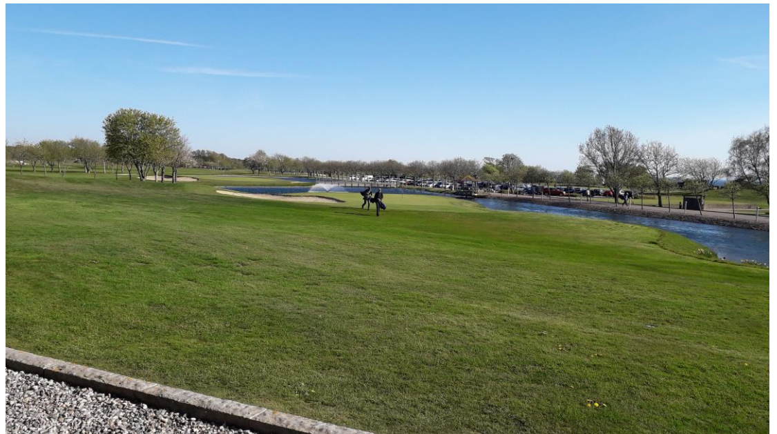
Fin utsikt från rummet.