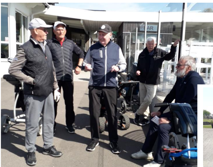
Här gäller det att samla sig inför första rundan.