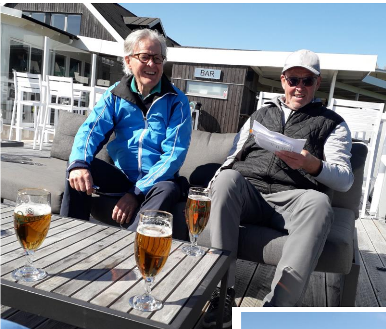
En öl satt fint efter avslutad runda, Även för rese- och tävlingskommittén. De båda CM skötte det galant.