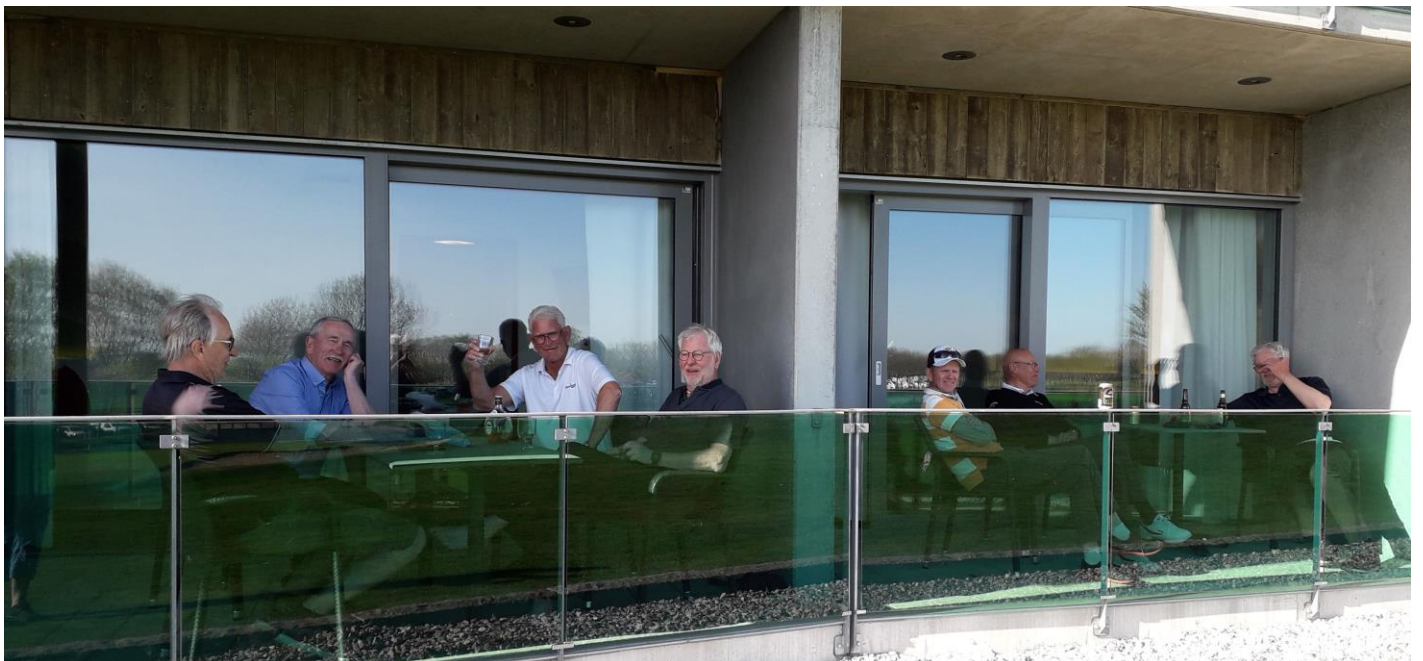
Här satt vi och gottade oss innan middagen.