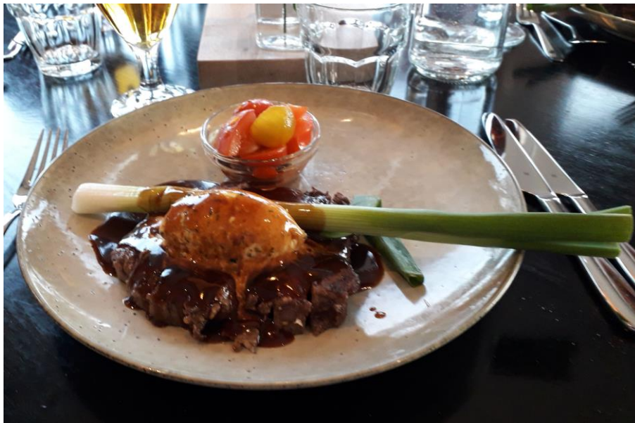
En vällsmakande entrecote med tillbehör.