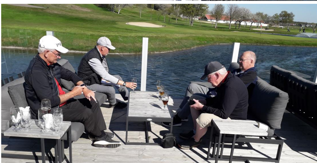
Nu gäller det att räkna ihop det hela.