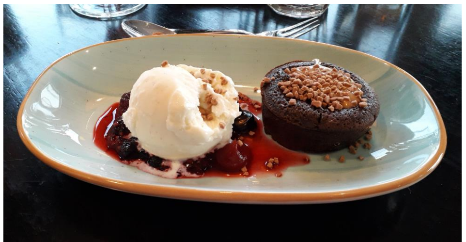
Glass med chokladmousse