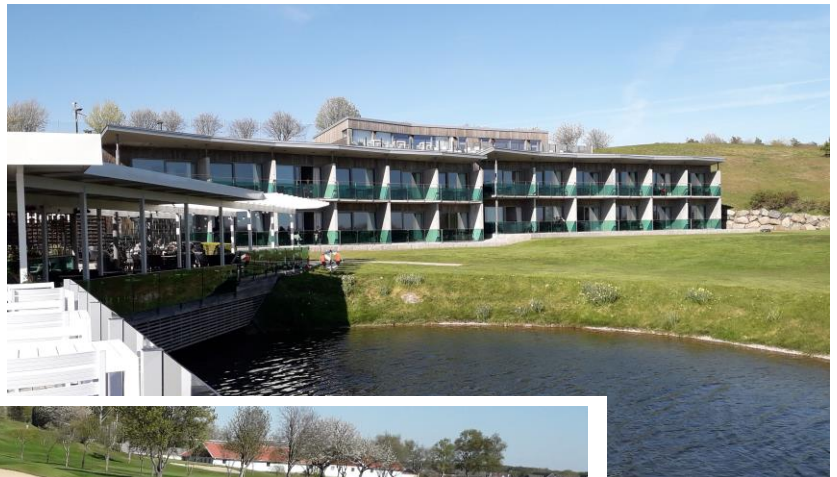
Här bodde vi i detta fina hotell.