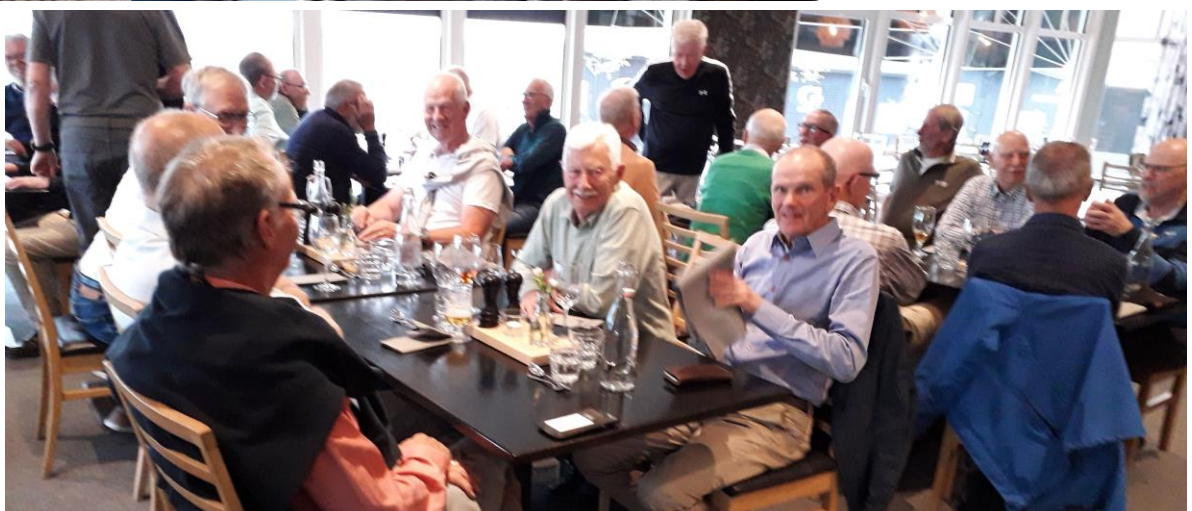
Det här var nog alla 37 deltagarna som var med.