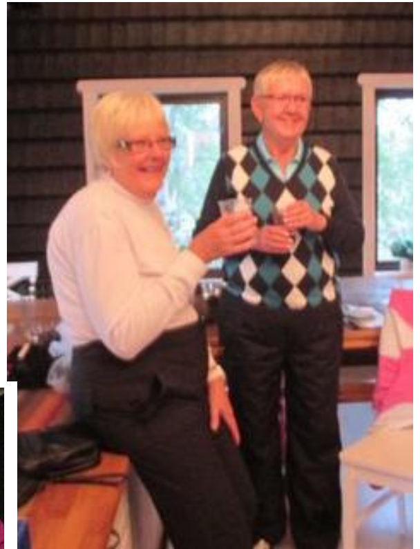
Skål och välkomna