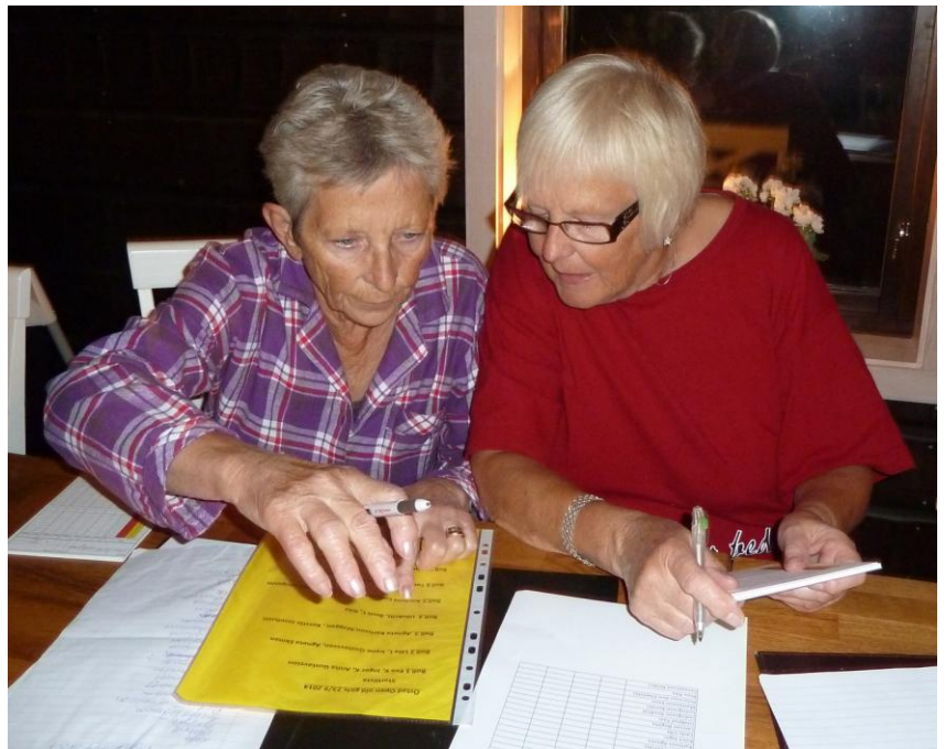
Några hade arbeta att utföra