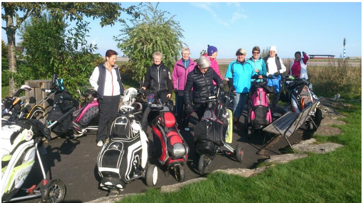
Nästa dag sken solen, lite kallt var det allt. Men detregnade INTE !!!