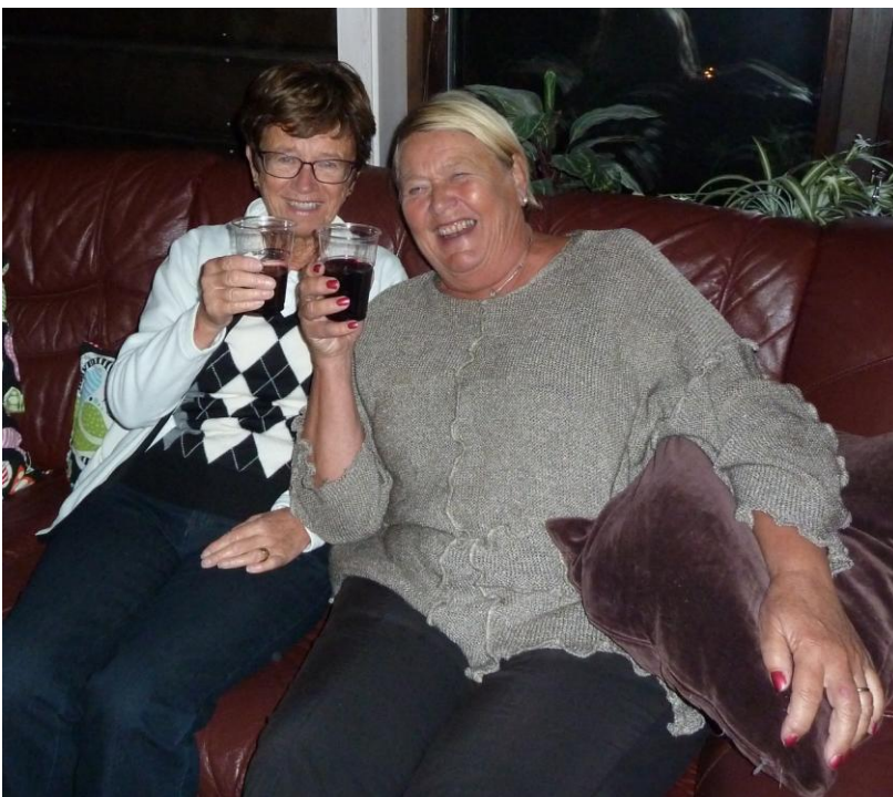
Medan andra körde igång direkt, fanns ju inget att vänta på.