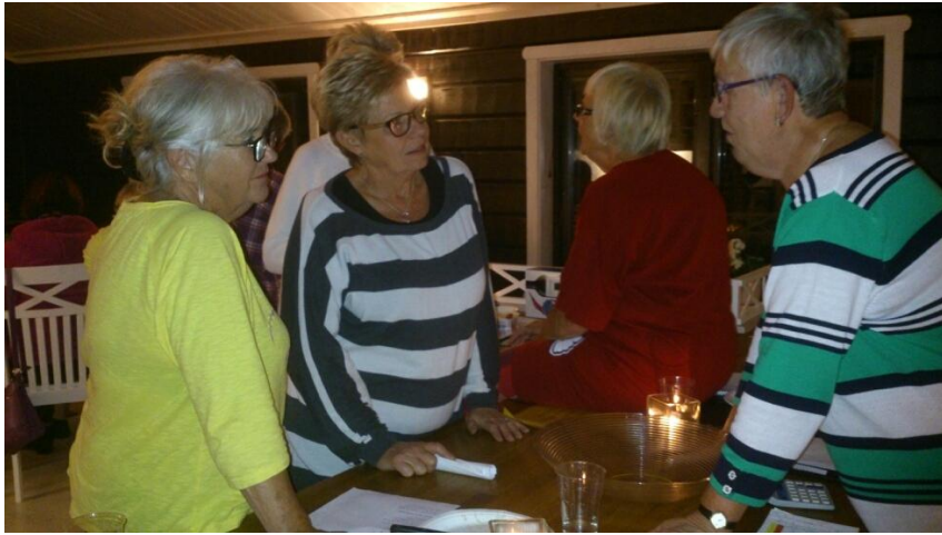
Hemma i storstugan