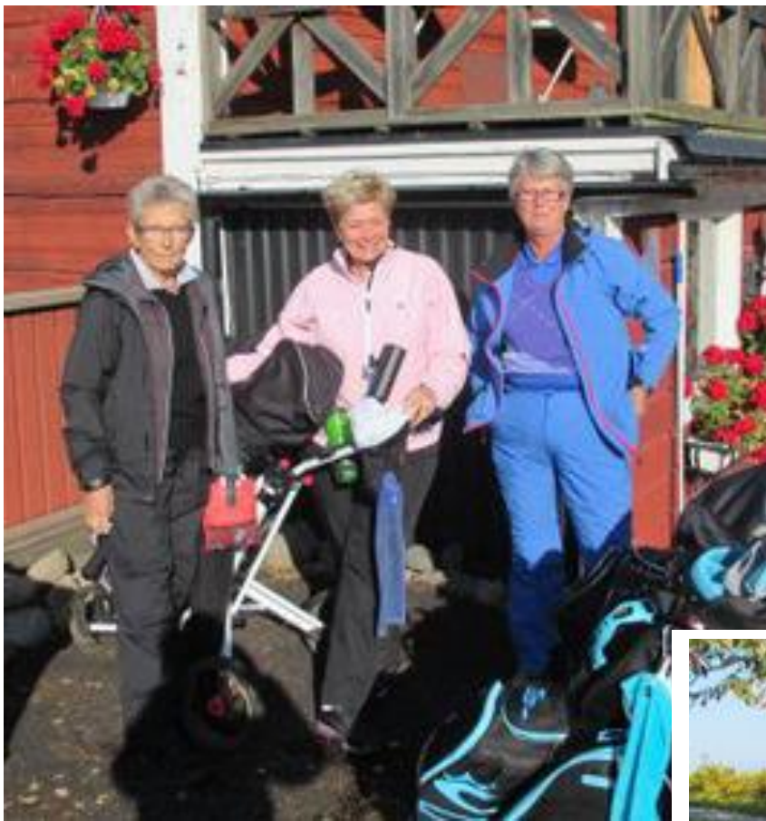
Pigga och laddade.