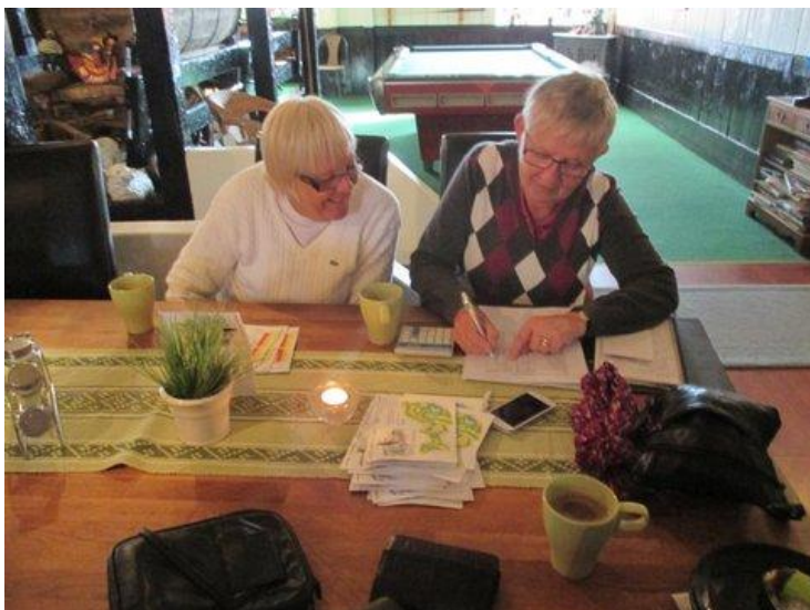
Efter rundan var det lite räkning igen