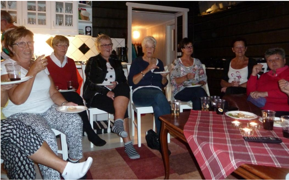
Detta är livet !!!!!!!