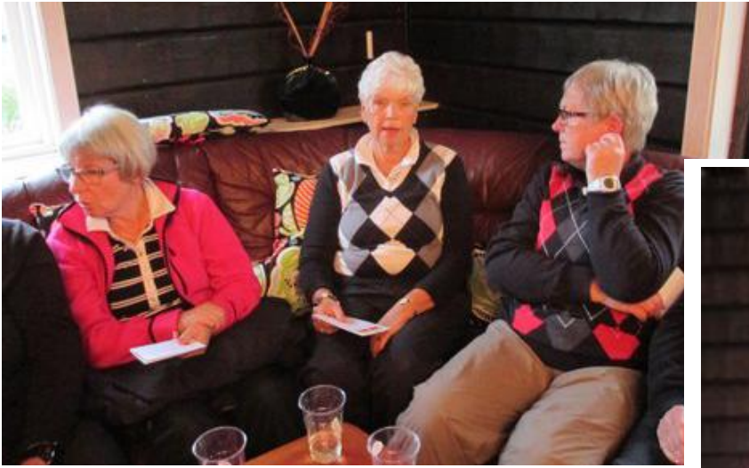
Samling i storstugan med välkomstdrink i väntan på att alla skulle komma och hitta någonstans att bo.