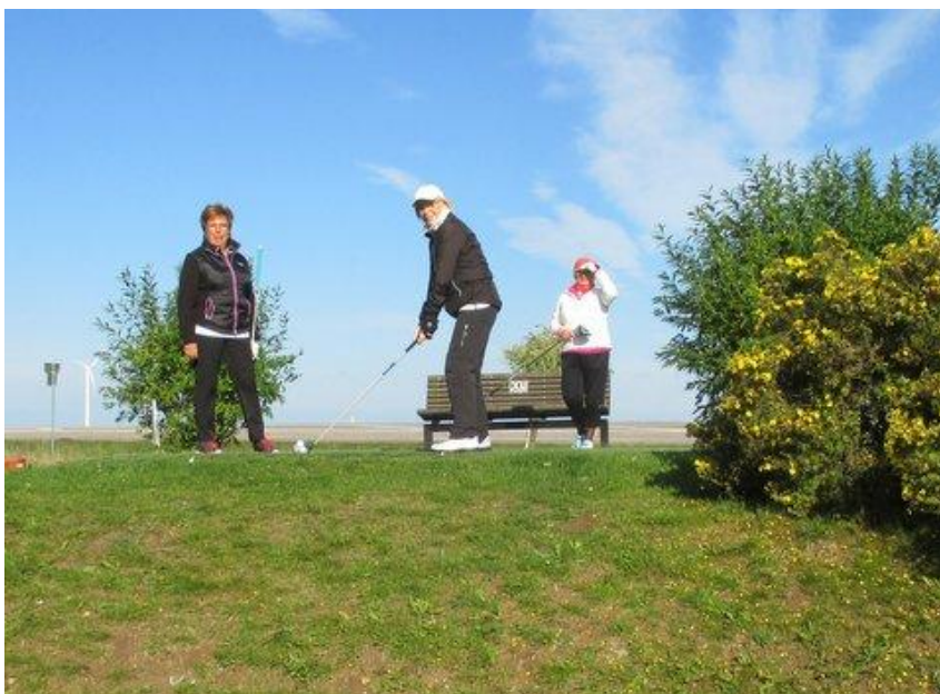
Lite stilla övningar var nog på plats, för syns skull.